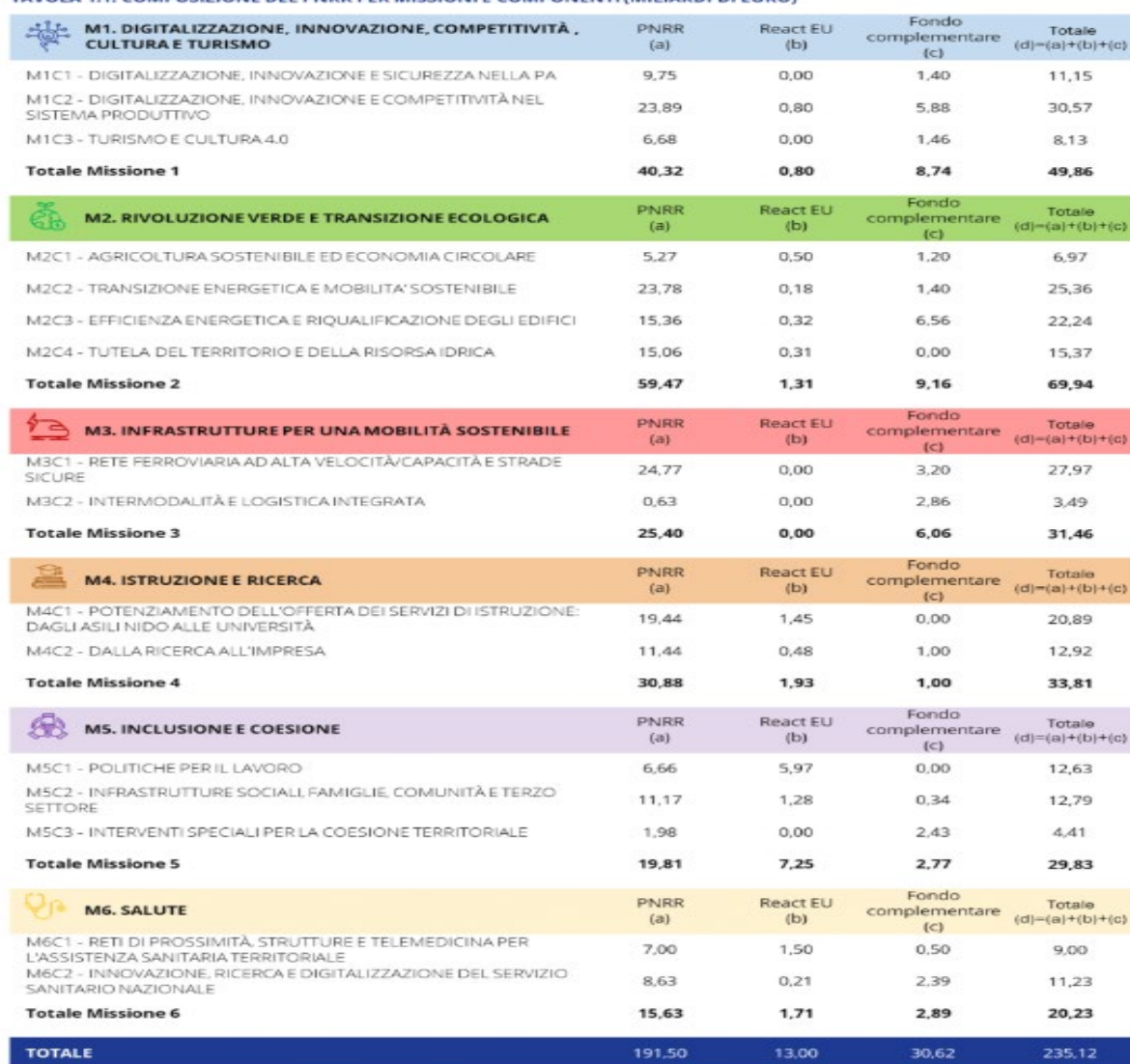
TAVOLA 1.1: COMPOSIZIONE DEL PNRR PER MISSIONI E COMPONENTI (MILIARDI DI EURO)

Una ulteriore riferimento per gli indirizzi e obiettivi strategici è rappresentato dal Piano nazionale di Ripresa e resilienza che orienta l'azione dell'amministrazione sempre in un'ottica di valore pubblico, il PNRR si sviluppa intorno a tre assi strategici condivisi a livello europeo, ovvero digitalizzazione, transizione ecologica, inclusione sociale, e si articola in 16 Componenti, raggruppate in sei Missioni: Digitalizzazione, Innovazione, Competitività, Cultura e Turismo; Rivoluzione Verde e Transizione Ecologica; Infrastrutture per una Mobilità Sostenibile; Istruzione e Ricerca; Inclusione e Coesione; Salute: